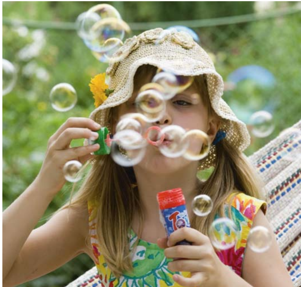
Mit Ihrer Spende erfüllen Sie Menschen mit einer Behinderung Ferienträume.

Nach ein paar Sekunden Schweigen antwortete er: Jeannette, das macht mich wirklich ein bisschen stolz. Es ist ja alles andere als selbstverständlich, dass eine Baslerin auf einen Berner zukommt. Das war die emotionale Reaktion, dann aber kam – verständlicherweise – die zweite, und nun sprach der Kopf: den Zeitrah-